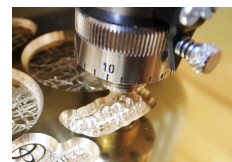
コンピューター彫刻機