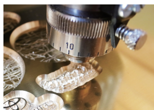
コンピューター彫刻機